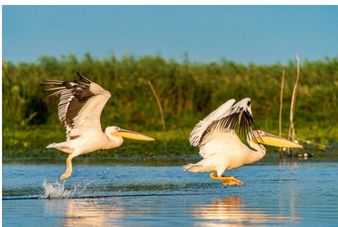
Pelikane im Donaudelta