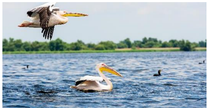
Pelikane im Donaudelta