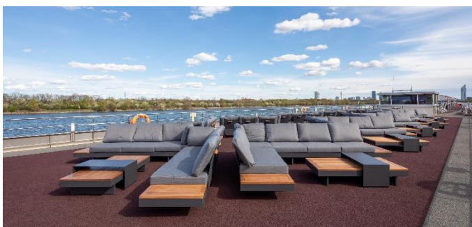
MS Nestroy, Lounge Sonnendeck