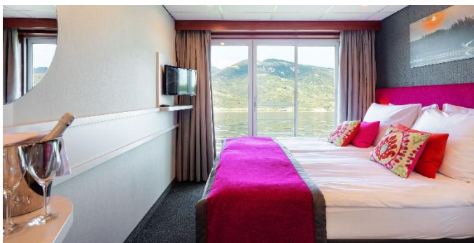
MS Nestroy, Doppelkabine Schiller- / Goethedeck